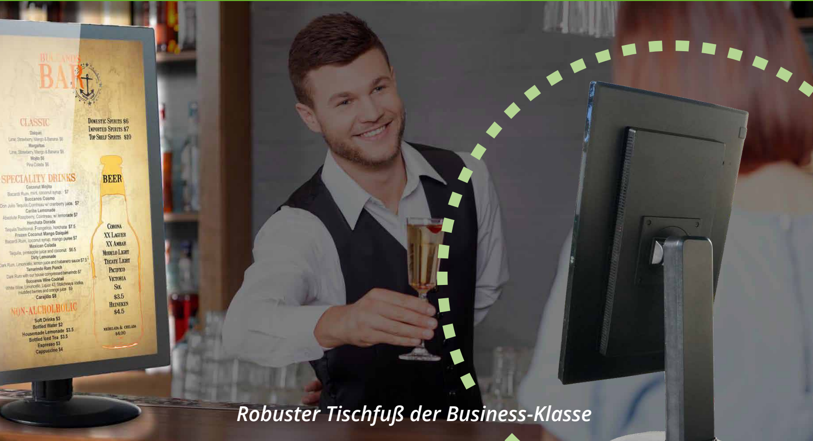
Robuster Tischfuß der Business-Klasse